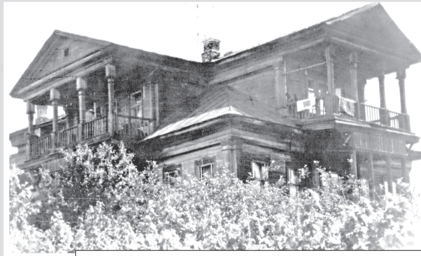
Несохранившийся до наших дней дом в усадьбе Фроловка