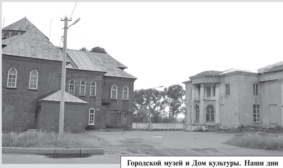
Городской музей и Дом культуры. Наши дни

Дом этот был построен в самые короткие сроки. Не дом, но дворец на крутом волжском обрыве. Его называют прекрасным образцом неоклассицизма начала XX века. Выступающий четырёхколонный портик под треугольным фронтоном приподнят парадным крыльцом, боковые фасады оформлены полуротондами, над крышей - купол парадного зала. Сегодня здание клуба является также памятником культуры регионального значения.