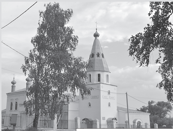
Богоявленский храм. Наши дни

Первые данные о Богоявленской церкви известны за 1628 год. В 1909 году о церкви сообщалось: "зданием каменная, с такою же колокольней, построена в 1778 году на средства прихожан. Ограда каменная, кладбище в полуверсте от церкви, обнесено каменной оградой с деревянным палисадником... Достопримечательностью церкви является местнотимая икона святых Зосимы и Савватия, соловецких чудотворцев. В церкви приделы в честь Богоявления, в честь святого Николая, в честь Дмитрия Ростовского и Архистратига Михаила. В 1909 году в церкви было прихожан мужского пола - 842, женского пола - 1022. При церкви - церковно-приходская школа женская, в приходе - Богоявленское земское училище".