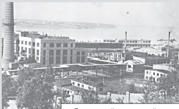
Заволжский химический завод имени Фрунзе. Фото 1980 годов.